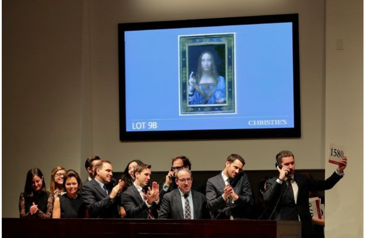
Leonardo da Vincis "Salvator Mundi" såldes för över 400 miljoner dollar på Christies i New York i november 2017.