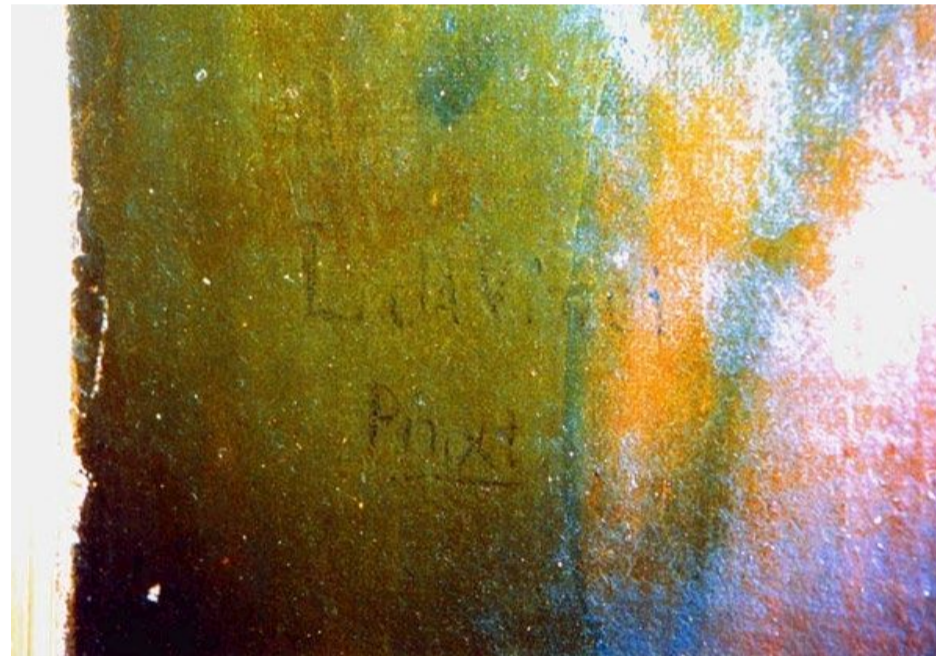
Signaturen är inte lätt att fotografera, men när man ger den rejält med ljus framträder bokstäverna: "L da Vinci" och "Pinxt".