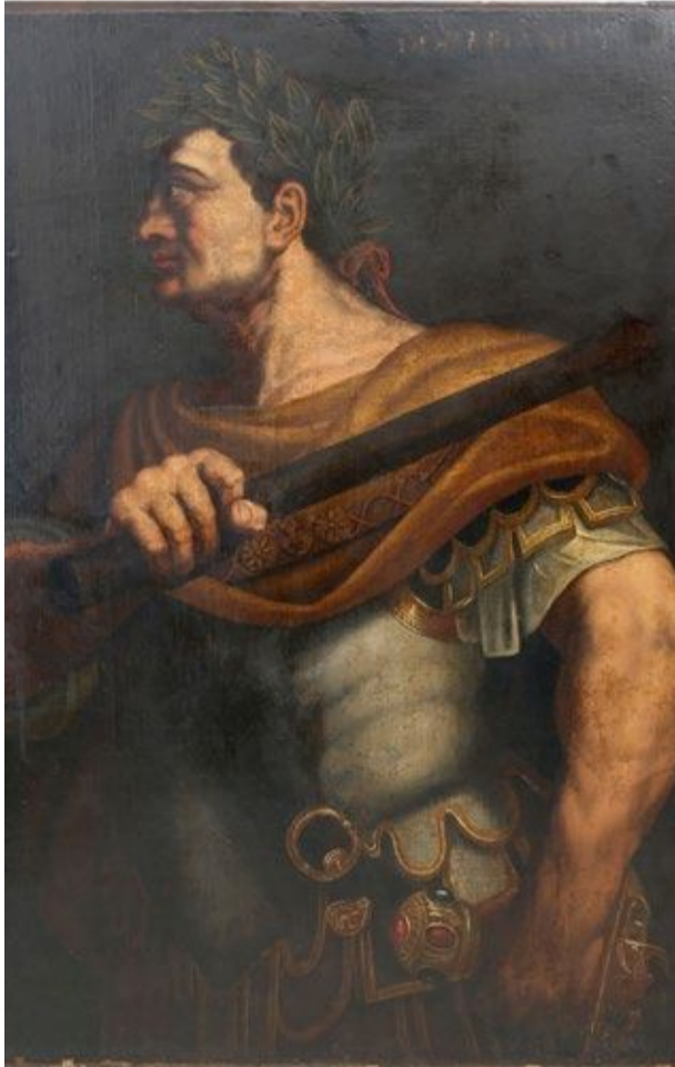
Den romerska kejsaren Domitianus avbildades på ett pampigt sätt. Han levde år 51 till 96 och målningen är troligen gjord kring sekelskiftet 1400-1500.