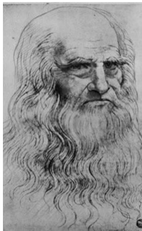
Självporträtt av Leonardo da Vinci. Han föddes den 15 april 1452 och dog 2 maj 1519. Han var konstnär, men också arkitekt, ingenjör, uppfinnare, naturforskare, matematiker, musiker och filosof.